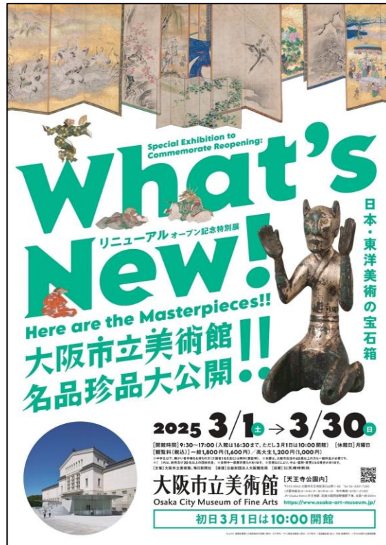
リニューアルオープン記念特別展 「What's New! 大阪市立美術館 名品珍品大公開!!」ポスタービジュアル

内容：本展では、館内の全フロアを特別展会場とし、絵画や書蹟、彫刻、漆工、金工、陶磁など分野ごとに選りすぐりの作品約250件を一室に展覧します。当館を代表する名品たちに加え、これまであまりご紹介する機会がなかった「珍品」ともいえる作品も織り交ぜ、大阪市立美術館の「変わらぬ魅力と新たな魅力」をお伝えします。